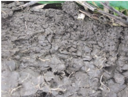
Foto 1: Bij niet-kerende grondbewerking is de bovenlaag heel mooi van structuur, maar daaronder is de grond verdicht.

In de Dollardpolders in Noord-Groningen wordt veel tarwe verbouwd. Dit gebeurt op zware grond (tot 80% afslibbaar). Enkele akkerbouwers zijn al zeven jaar bezig om ploegen en niet-ploegen te vergelijken. De grond reageert heel verschillend op beide bewerkingsmethoden (Foto 1, 2, 3).