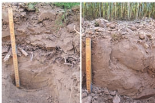
Foto 1 en 2: Ploegen (links) vergeleken met nkg (rechts) in proefvelden met tarwe in Tongeren. Bij ploegen is de structuur van de geploegde laag van 0-17 cm mooi. Scherpblokkige elementen zijn vrijwel afwezig. Daaronder bevindt zich de slecht verteerde resten van de maïs van het vorige teeltseizoen en daaronder een extreem verdichte laag. Toch kunnen wortels door deze verdichte laag door de aanwezige verticale wormgangen. Onder 45 cm is de bodemstructuur weer zeer poreus en goed doorwortelbaar.

Bodemstructuur, beworteling en bodemlevenactiviteit zijn kwalitatief beoordeeld. Het effect van nkg verschilde per grondsoort: op zwaardere gronden leidde nkg tot iets meer bodemlevenactiviteit en een betere structuur in de bovenste 30 cm dan ploegen. Op zand leidde nkg juist vaak tot verdichting onder de bewerkte laag, resulterend in een minder goede beworteling. Bij kerende grondbewerking waren vaak nog gewasresten aanwezig net beneden de bewerkte laag terwijl deze met nkg al verteerd waren (Foto's 1 en 2).