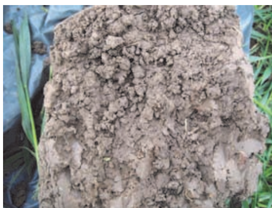
Foto 2 & 3: Op 20 cm. diepte is de bodemstructuur bij niet-kerende grondbewerking extreem verdicht (boven). Bij ploegen is de grond op 20 cm. diepte veel lossier

De tarweopbrengsten zijn bij beide systemen vergelijkbaar. Mochten de regenwormen op langere termijn de grond dieper losmaken dan niet-kerende grondbewerking gunstiger uitpakken. Op zware gronden zijn het de regenwormen die helpen om bij niet-kerende grondbewerking een goed resultaat te krijgen: